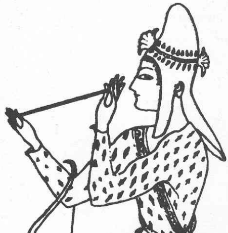
Amazone vom Alabastron aus Odessa

Es handelt sich also sicher nicht um eine genuin römische Mütze. Trotzdem wurde ausprobiert, ob sich die Mütze als 'arming-cap' eignet.