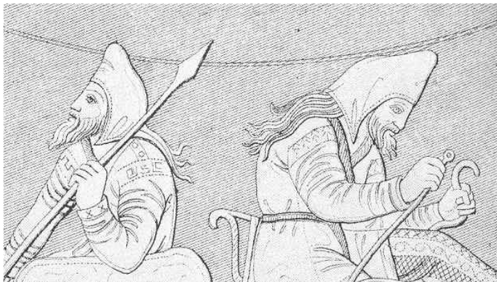
Goldbecher aus dem Kul'Oba Kurgan (4. Jh. v.Chr.)

Die Mütze zeigt frappierende Ähnlichkeit mit dem noch heute bei Steppenvölkern verwendeten bashlyk . Derartige „phrygische Mützen“ wurden schon von den Skythen und Sarmaten verwendet, wie einige Beispiele zeigen: